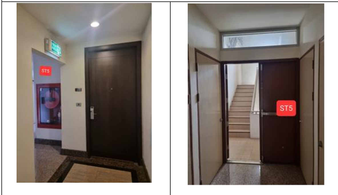
ป้ายบอกทางหนีไฟ ประตุนิไฟ และบันไดหนีไฟ

รูปที่ 2.4.6-1 อุปกรณ์ป้องกันอัคคีภัย อุปกรณ์แจ้งเหตุอัคคีภัย ป้ายบอกทางหนีไฟ ประตูและบันไดหนีไฟ