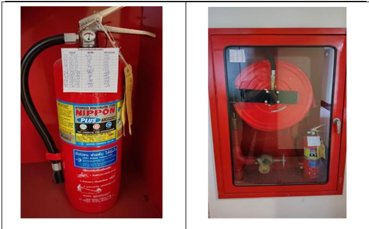
ป้ายบอกทางหนีไฟ ประตุนิไฟ และบันไดหนีไฟ